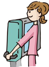
令和8年度 大腸がん検診・胸部レントゲン検査実施医療機関一覧

険者健診の対象となる方は、各健診該当月に同時に受診してください。 場 下表の市内実施医療機関 他 ▼ 大腸がん検診 = 便潜血検査 2日法(検便検査) ※ 内視鏡検査ではありません。 ▼ 胸部レントゲン検査 = 胸部のレントゲン撮影 他 ▼ 大腸がん検診 = 市内在住で9年3月末時点の年齢が40歳以上の方。ただし、次の①・②のいずれかに該当する方は、受診前にかかりつけ医にご相談ください。 ①現在、大腸やその他の腸の疾患で治療中または経過観察中の方 ②過去に大腸がんの精密検査で異常を指摘された方 ※ 生理中を避けて受診してください。 ▼ 胸部レントゲン検査 = 市内在住で9年3月末時点の年齢が40歳・45歳・50歳・55歳・60歳の方および65歳以上になる方 費用 いずれも500円(受診医療機関でお支払いください。生活保護受給者などは無料。ただし、受給証明書などの提出が必要) 対象 検体を提出されなかった場合でも、自己負担金は返却できませんので、あらかじめご了承ください 申込 直接下表の実施医療機関へ 申込 健康課 特定健診係 ☎042・477・0013