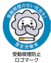
受動喫煙防止ロゴマーク