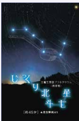
「じっくり北斗七星」広報画像

ひしゃくの形で知られる北斗七星。見え方や逸話など、多くの見どころがあります。北の空に輝く北斗七星を当日の星空とともに、じっくりご紹介いたします(約45分間)。 日 6月2日(火)～7月31日(金) 場 多摩六都科学館 定 先着220人 費用 観覧券(展示室+プラネタリウム1回)1,040円(4歳～高校生420円) 対象 小学2年生以下の方は保護者と観覧してください 他 ▼ 6月の休館日は1日(月)・8日(月)・15日(月)・22日(月)・29日(月) ▼ 投影日時は同館 印 でご確認ください 申込 当日開館時よりインフォメーションにて観覧券を販売 申込 同館 ☎042・469・6100