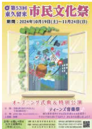
第53回のポスター (中央のデザイン画を募集)

秋の文化の祭典「第55回市民文化祭」の開催にあたり、同文化祭ポスターに採用するデザイン画を募集します。