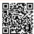
市☎ (熱中症について)