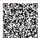
市☎ (安心くるめーる)