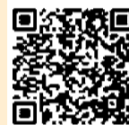
国税庁 LINE公式 アカウント

用 確定申告会場への入場にはオンライン事前予約が必要です。LINEアプリで国税庁公式アカウントを「友だち追加」して予約してください。当日、確定申告会場でも入場整理券を配付しますが、当日入場整理券の配付が終了次第、事前予約の方以外の受け付けを締め切ります