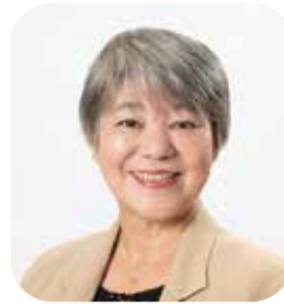
北村 のり子 日本共産党