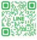
SMS申し込みフォーム LINE

◎通知サービスについて 精神障害者保健福祉手帳または自立支援医療受給者証(精神通院)をお持ちの方に、更新手続開始1週間前にSMS(ショート・メッセージ・サービス)またはLINEにより通知するサービスを行っています。通知を希望される方は、二次元コードよりお申し込みください。