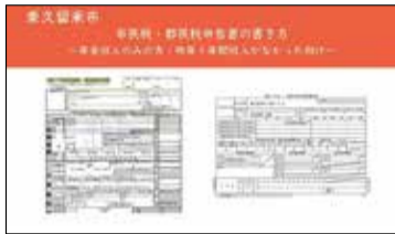
申告書の書き方動画