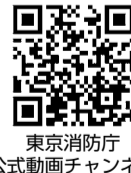
東京消防庁 公式動画チャンネル

育てよう 歴史を守る 文化財防火デーの制定は、昭和24年1月26日に、現存する世界最古の木造建造物である法隆寺の金堂が炎上し、壁画が焼損したことに 消防防災訓練や防災教育等に参加 ▼震災発生時 消防署の後方支援活動 申 東久留米消防署防災安全係 ☎042・471・0119