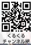
くるくる チャンネル

「開運! 東久留米七福神めぐり」は、市内5つのお寺(多聞寺、米津寺、大圓寺、宝泉寺、浄牧院)に祀られている七福神を巡り、1年の幸福や安全を祈願するお正月のウォーキングイベントです。