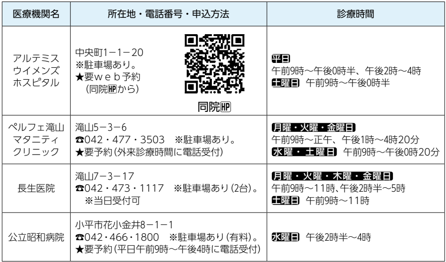
表 子宮頸がん検診 実施医療機関一覧

㊦ 8年1月13日(火)午前10時～11時半 ㊦ 1・2歳児の遊び・生活・しつけなど子育ての悩みをテーマに話し合い。一人で悩まず、一緒に考えましょう ㊦ 1～2歳児の保護者 ㊦ 8人 ㊦ お子さんの保育あり(要予約) ㊦ 12月16日(火)午前10時から電話または同ひろば上の原で