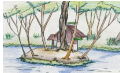
いつくしまじんじゃ 殿 島神社

市内の川は、川の水があふれだすのを防ぐための改修工事をしたことで、川にそって 遊歩道ができたところがあります。近くに公園ができています。