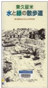
H29 『東久留米 水と緑の散歩道』 (東久留米ほとけ どじょうを守る会)