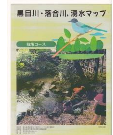
H51 『黒目川・落合川・湧水マップ』 (東久留米市湧水・ 河川フォーラム実行委員会)