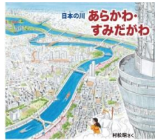
H51 『あらかわ・すみだがわ』 松村 昭／さく (偕成社)