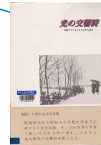
H74 『光の交響詩』 東久留米市教育委員会／編 (東久留米市教育委員会)