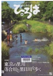
H51 『緑と水のひろば No.84』 (東京都公園協会)