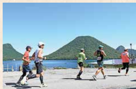
過去の開催の様子

高崎市を代表する風光明媚な観光地「榛名湖」を舞台に、日本一標高の高い日本陸上競技連盟公認コースを走るフルマラソン大会が、9月29日(日)に開催されます。