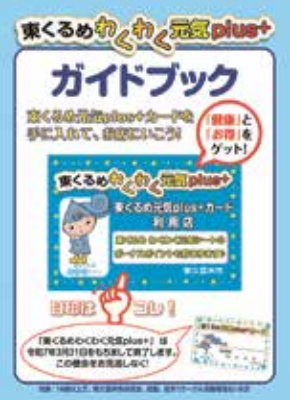
ガイドブックの表紙

ガイドブック配布場所 市役所(屋内ひろば「市内案内板」、「市政情報コーナー」(1階)など)、健康課(わくわく健康プラザ内)、各図書館、各地域センター、スポーツセンターなどの市公共施設、東久留米駅の市情報BOX ※市HPからも取得可。 対象者 16歳以上で市内在住・在勤・在学(サークル活動も含む)の方 カード申請場所 健康課(わくわく健康プラザ内)または産業政策課(市役所6階) ※市HPからも申請可。 健康課保健サービス係☎042・477・0022