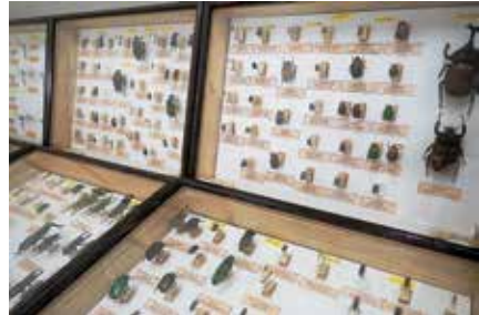
昨年の展示の様子