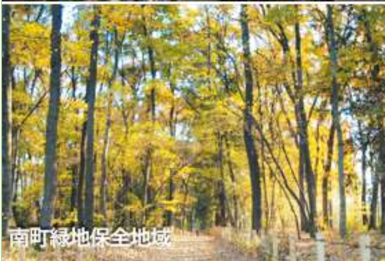
南町緑地保全地域