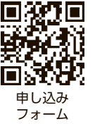
図 申し込みはがき記入項目

望に添えない場合があります。あらかじめご了承ください 申 12月1日(金)~14日(木)に原則申し込みフォームでお申し込みください。申し込みフォームで検診車(たくわく健康プラザ)を予約する場合、申し込み時に、日時を確定できます。申し込みフォームでの申請が難しい方は、1人1枚のはがきに必要事項(下図参照)を記入の上、〒203-0033、滝山4-3-14、たくわく健康プラザ内、健康課特定健診係宛て郵送(消印有効)を。1月から申し込み結果を順次返信します 問 同係 ☎042・477・0013