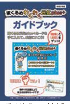
ガイドブック(表紙)