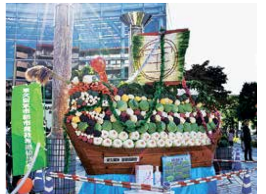
前回開催時の宝船