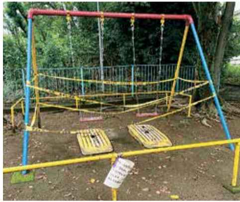
老朽化した遊具の一例