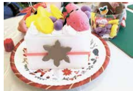
粘土のクリスマスケーキ