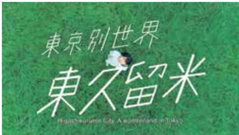
東久留米市プロモーション動画