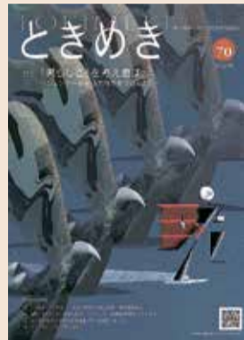
「ときめき」第70号の表紙