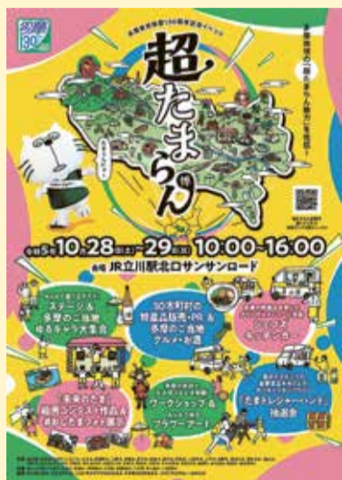
イベントのポスター

10月28日(土)・29日(日)午前10時～午後4時。場JR立川駅北口サンサンロード(立川市曙町2丁目) 同多摩の魅力発信プロジェクト事務局03・5738・8904または都総務局行政部振興企画課03・5388・2443