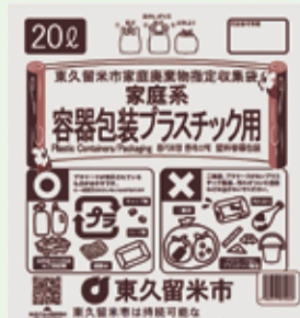
新デザインの容器包装プラスチック用

市では、家庭ごみの減量と分別を考えていただくきっかけとして、指定収集袋「容器包装プラスチック用」(20リットル20枚)を市内全戸に配付します。また、ごみの分別が分かりやすくなるよう指定収集袋のデザイン変更を来年度に予定しており、今回お配りするのは変更後のものです。