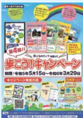
キャンペーンのチラシ

マップ入手場所 わくわく健康プラザ・市役所・図書館・各地域センター・各地区センター・スポーツセンター・生涯学習センターなど(市からも取得可)