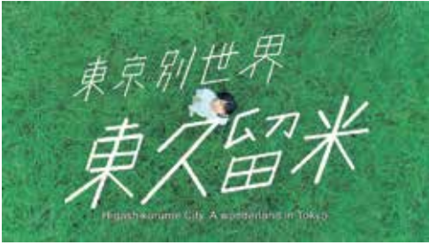
東久留米市プロモーション動画