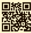
イベント特設サイト