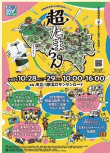
イベントのポスター

10月28日(土)・29日(日)午前10時～午後4時。場JR立川駅北口サンサンロード(立川市曙町2丁目) 同多摩の魅力発信プロジェクト事務局03・5738・8904または都総務局行政部振興企画課03・5388・2443