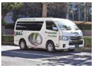
市役所前を走る「くるぶー」