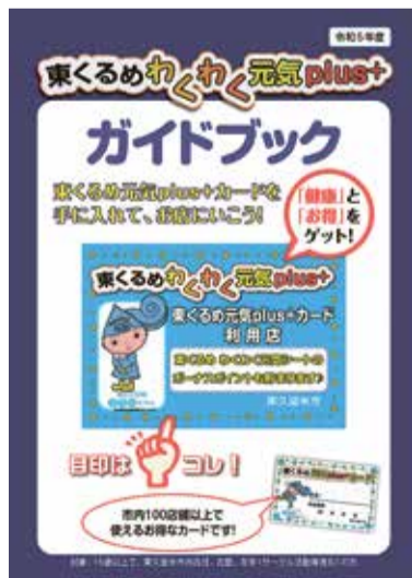
ガイドブック(表紙)