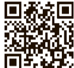
申し込みフォーム

自分も相手も大切にできるコミュニケーション、アサーティブの基本的な考え方やスキルを学びます。自分自身を大切に、自分らしくいられる表現を身につける一歩にどうぞ。 対9月14日(休)午後2時～3時半 場市役所7階704会議室 対身近な人との関係にストレスを感じている女性、なんとなく生きづらさを抱えている女性 対先着15人(要申し込み) 対柴田悦子氏(NPO法人ウィメンズ・サポート・オフィス連代表、働く女性のホットライン相談員) 対9月1日(金)午前9時から申し込みフォーム、男女平等推進センター宛て 対(fifty2@city.higashikurume.lg.jp)、または電話(対042・472・0061)で 対同センター 対申し込みフォーム