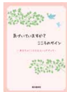
パンフレット(表紙)