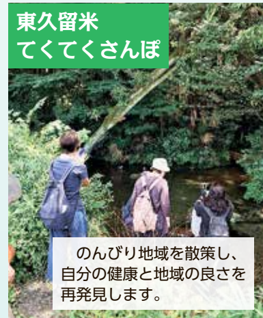
のんびり地域を散策し、自分の健康と地域の良さを再発見します。