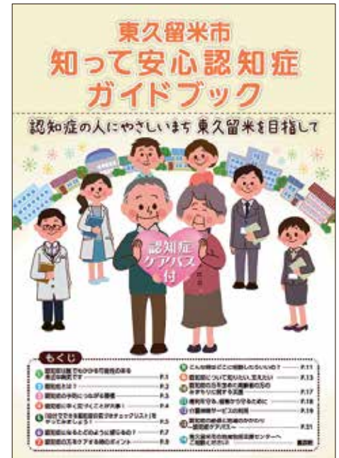
「東久留米市知って安心認知症ガイドブック」の表紙