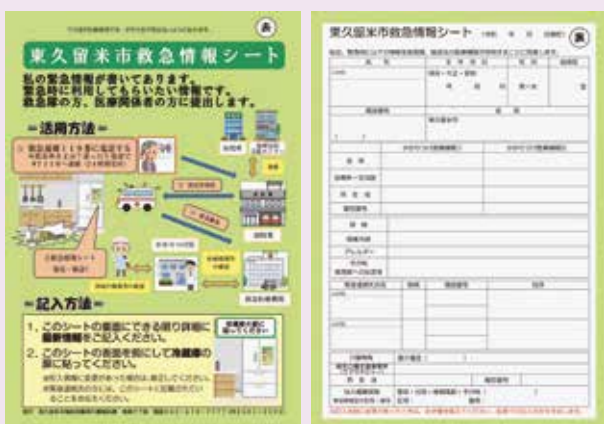
東久留米市救急情報シート