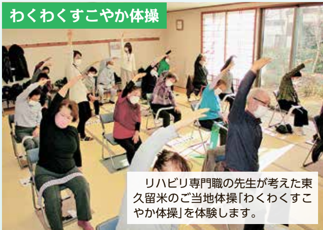
リハビリ専門職の先生が考えた東久留米のご当地体操「わくわくすこやか体操」を体験します。