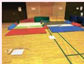
導入されたモルック