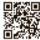
FMプラブラ TOKYO 854 公式アプリ

※事前登録方法など、詳しくは特設印をご覧ください。▼シェイクアウト訓練とは=2008年にアメリカで始まった、地震の際の安全確保行動である「命を守る3動作」を約1分間で行う防災訓練です同防災防犯課防災防犯担当☎042・470・7769