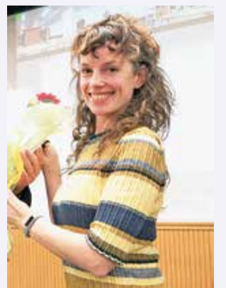
ダニエラ・ハダシュ氏

9月3日(日)午後1時半～3時半(場)①多摩六都科学館②オンライン(Zoom)(対)小学5年生以上(定)①20人(応募者多数の場合は抽選し、当選者のみに参加券を送付します)②先着80人(師)ダニエラ・ハダシュ氏(東京大学宇宙線研究所助教)他(費)①入館料520円(高校生以下210円)②無料(通信費は自己負担)(注)▼①参加者以外の入室不可▼オンラインは前半の講演部分のみ視聴できます▼講演はすべて英語です。通訳はありません(甲)▼①8月21日(月)までに(必着)、同館(問)またははがきで申し込みを。はがきの場合はイベント名・開催日時・氏名(フリガナ)・年齢(学年)・郵便番号・住所・電話番号を記入の上、〒188-0014、西東京市芝久保町5-10-64、多摩六都科学館宛て郵送を▼②8月1日(火)正午から、同館(問)で(問)同館(☎)042・469・6100