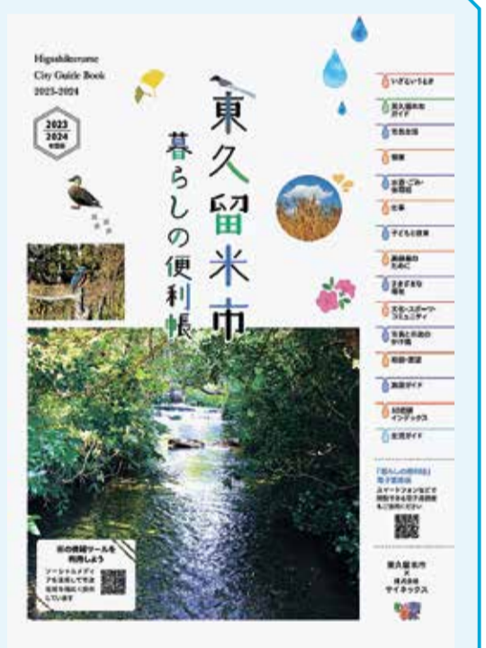
暮らしの便利帳表紙