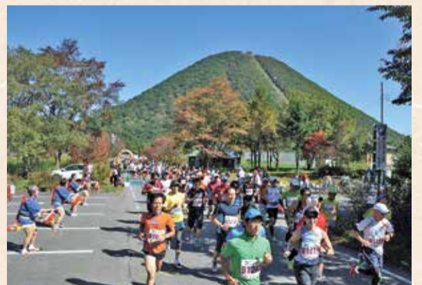
過去の開催の様子

高崎市を代表する風光明媚な観光地「榛名湖」を舞台に、日本一標高の高い日本陸上競技連盟公認コースを走るフルマラソン大会が、9月24日(日)に開催されます。