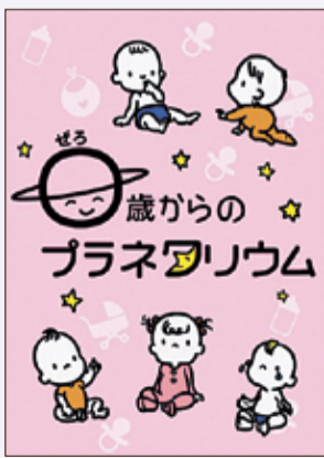
イベントのイメージ画像