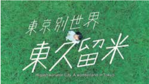
東久留米市プロモーション動画