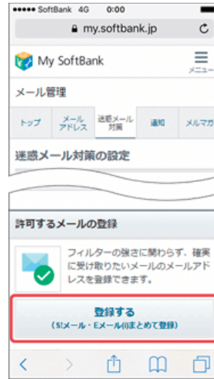
(3) 「許可するメールの登録」の「登録する」を押します。