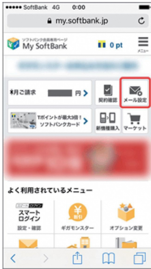
(1) My SoftBankへアクセスし、「メール設定」を押します。