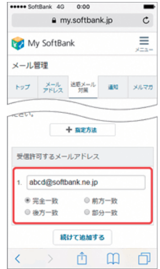
(4) メールアドレスの一部、または全部を入力し、指定方法を選択します。