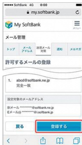
(6) 「登録する」を押します。