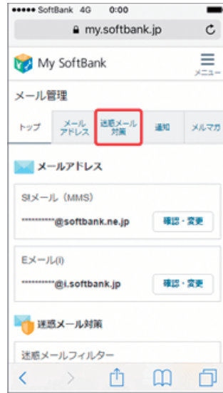
(2) 「迷惑メール対策」を押します。