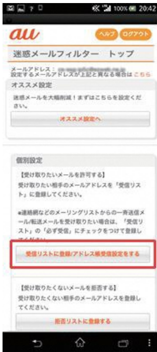
(1) [受信リストに登録／アドレス帳受信設定をする]を選択