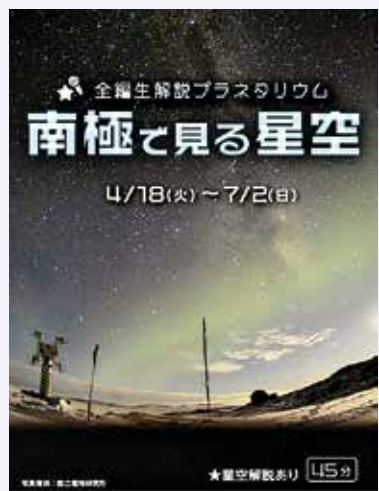
「南極で見る星空」のチラシ

7月2日(日)までの午後3時50分～4時35分、水曜・土曜・日曜日は午後1時10分～1時55分もあり ※6月28日(水)午後1時10分の回は別プログラムを投影します。 多摩六都科学館 どの年齢でも ※小学2年生以下の方は保護者と観覧してください。 先着234人 観覧券付入館券(展示室+プラネタリウム1回)1,040円(4歳～高校生420円) 当日開館時よりインフォメーションにて観覧券を販売 同館 042・469・6100