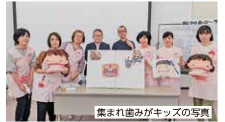
集まれ歯みがキッズの写真