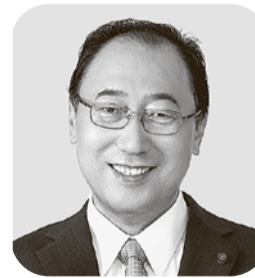
関根 みつひろ 公明党・現