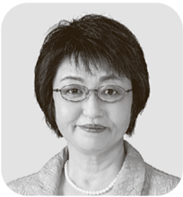
あべ りえこ 公明党・現