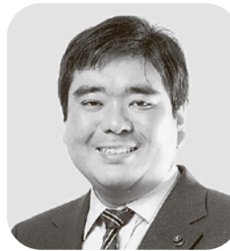
北村 りゅうた 日本共産党・現