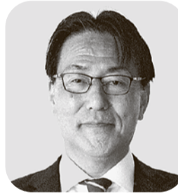
島崎 孝 自由民主党・現