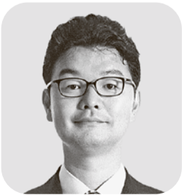
村山 順次郎 日本共産党・現