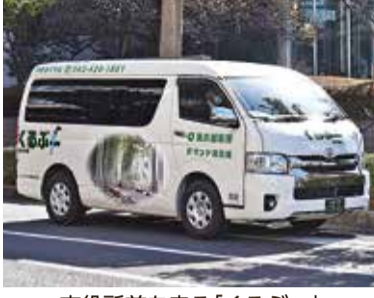
市役所前を走る「くるぶー」

要事項を記入の上、次のいずれかの方法で提出してください①道路計画課(市役所5階)窓②郵送(〒203-8555、市役所秘書課宛て郵送を)③FAX(042・470・7809)④インターネット(市HPまたは専用フォームから)