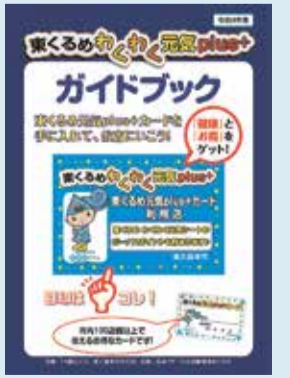
ガイドブックの表紙