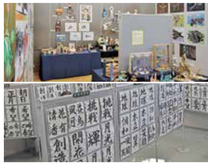
過去の展示の様子