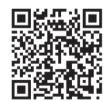
しおかるくるめスープ(適量スープレシピ)

各教室や講座、東くるめの野菜レシピのお問い合わせは、健康課保健サービス係 ☎ 042-477-0022