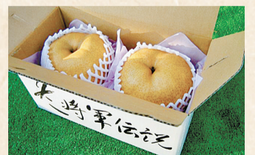
ジャンボ梨「冬将軍伝説」

クリスマス頃がおいしい王秋、正月が食べ頃の愛宕、節分まで食べられる新雪などがあり、なかでも愛宕と新雪はすぐ食べても甘いですが、3カ月くらい保存して追熟させることで酸味がぬけて甘みが増し、まるやかになります。