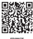
11月20日(日)限定 無料シャトルバス時刻表