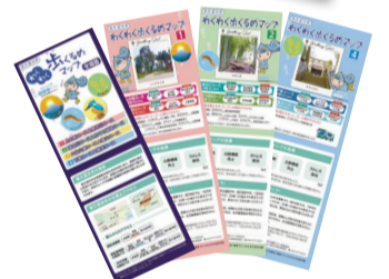
表 ウォーキングマップ「わくわく歩くるめマップ」