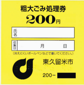
新しい粗大ごみ処理券

榛名地域宿泊助成制度 市では、榛名湖周辺の宿泊施設と契約を結び、利用料金の一部を助成していただきます。 対市内在住で6歳以上の方 助成金額10000円(年度につき1人1泊まで) 利用方法 「宿泊施設利用券」が必要です。利用券の交付は、右下表の宿泊施設に直接予約した上で、生活文化課(市役所2階)へ申請してください。 ※利用料金は、各施設に直接問い合わせてください。 問 同課 ☎042・470・7738