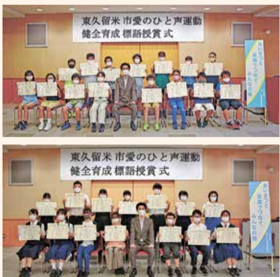
優秀賞受賞者の皆さん

東久留米市愛のひと声運動実施委員会では、6月に健全育成標語の募集を行いました。市内在住・在学の小学5・6年生および中学生から3,012作品の応募をいただき、その中から下記の35点の優秀作品を選出しました。