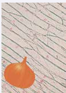
同イベントポスター

日11月2日(水)午前10時半～正午場多摩六都科学館 対18歳以上 定12人 講師ヨネ・プロダクション 費用入館券520円 他参加者以外の入室不可 申10月21日(金)までに(必着)、同館ウェブサイトまたははがきで申し込み。はがきの場合、イベント名・開催日・氏名(フリガナ)・年齢・郵便番号・住所・電話番号を記入の上、〒188-0014、西東京市芝久保町5-10-64、同館宛て郵送を(応募多数の場合は抽選し、当選者のみに参加券を送付) 同館 042・469・6100