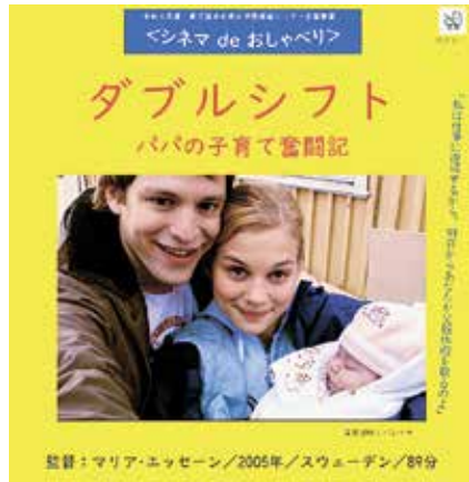
イベントのポスター