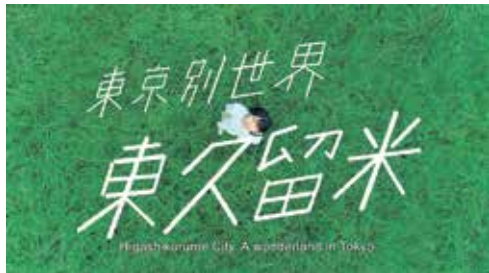
東久留米市プロモーション動画