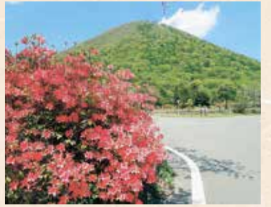
榛名富士とヤマツツジの花

5月になると榛名湖周辺の木々が芽吹き、「ヤマザクラ」「ヤマツツジ」「レンゲツツジ」が次々と花を咲かせます。