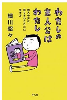
『わたしの主人公はわたし』 細川貂々著、2017年