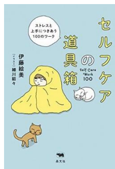
『セルフケアの道具箱』 伊藤給美著、2020年