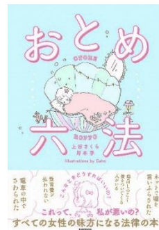
『おとめ六法』 上谷さくら著、2020年