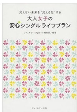
『見えない未来を“見える化する” 大人女子の 安心シングルライフプラン』