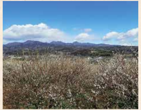
榛名梅林より榛名山を望む

榛名地域の梅栽培は明治期に始まり、生産量は東日本一を誇ります。中でも上里見町の榛名梅林は、榛名山を望む里見丘陵の一角が広大な梅林となっており、360度の素晴らしい景色を楽しめます。花は3月上旬頃に甘い香りを漂わせながら咲き始め、3月下旬頃まで楽しむことができ、5月下旬頃から実の収穫が始まります。