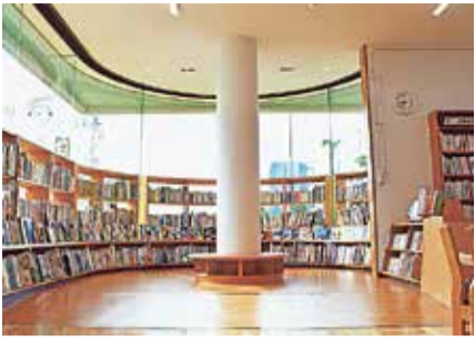
児童室の一角(中央図書館1階)