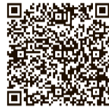
▲電子申請のページ

れる方に個別相談を行います。市内在住の4年3月末時点で、20歳・25歳・30歳・35歳・40歳・45歳・50歳・55歳・60歳・65歳の女性 150人(応募多数の場合は抽選) 500円(生活保護受給者などは無料。ただし、受給証明書の提出が必要) 11月19日(金)までに、次のいずれかの方法で申し込みを。①電話②電子申請③1人