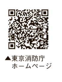
▲東京消防庁 ホームページ

大雨や台風などによって、日本は毎年のように風水害に見舞われています。特に近年は、集中豪雨や巨大化した台風による浸水や洪水、土砂災害などが各地に甚大な被害をもたらしています。被害を抑えるためには日頃からの備え