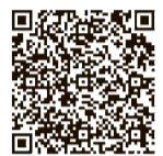
（改定版）に関するページ にアクセスする ため、同ホームページ に掲載されています。

「財政健全経営計画」は、 市の最上位計画である「長期 総合計画」を財政面から支え るものです。財政健全経営計 画は、財政健全運営に向けた 方向性を示す「基本方針」と 基本方針を受けた具体的な取 り組みを示す「実行プラン」 から構成されています。