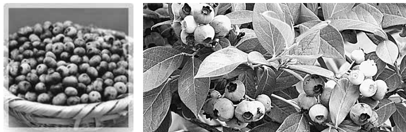
▲榛名地域のブルーベリー

号)・参加希望日・通勤または通学先(多摩地域にお住まいでない方のみ)を記入の上、〒190-0181、西多摩郡日の出町大字大久野7642番地、同組合「夏休み処分場見学会」係宛て郵送を 同日センター 042・597・6152または同組合ホームページで確認を