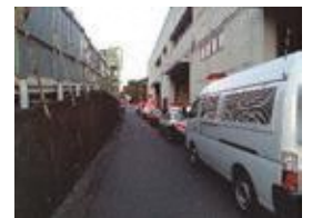
令和2年10月29日の爆発事故の様子