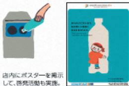
店内にポスターを掲示して、啓発活動も実施。

ペットボトルの回収に協力していただくと、ペットボトル5本で1nanacoポイントに交換できるリサイクルポイントをプラス。また、圧縮力の強い自動回収機を採用することで、ペットボトル運搬用自動車の台数を減らし、CO 2 削減にもつなげています。