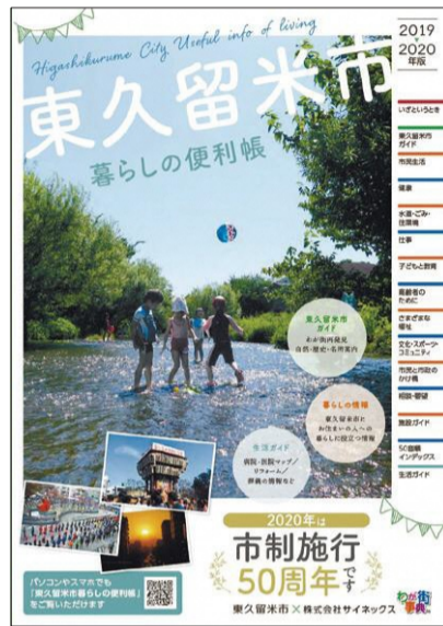
▲現在の「暮らしの便利帳」の表紙

詳しくは同社埼玉支店☎048・643・7120、発行についてが、市秘書広報課☎470・7708へ。