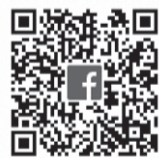
▲東久留米手をつなぐ親の会フェイスブック

障害のある人となない人の相互理解を目的として始まった作品展です。毎年市民プラザホールで開催していましたが、今年は感染症を予防し、新しい作品展を皆さんにお届けするため、インターネットを利用します。ご興味のある方は上のQRコードからご覧ください(通信にかかる費用は自己負担になります)。新しい時代の優しい時間をご一緒できますよう