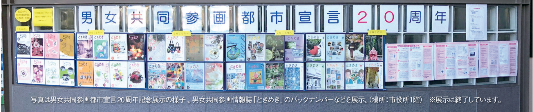
写真は男女共同参画都市宣言20周年記念展示の様子。男女共同参画情報誌「ときめき」のバックナンバーなどを展示。(場所:市役所1階) ※展示は終了しています。

市は、すべての人が、その性別にとらわれることなく、互いの人権を尊重し、また、自らの意思で行動し等しく責任を担い、思いやりを持って生きる社会の実現をめざし、この美しい町とともに男女共同参画都市を次の時代に引き継ぐために、今から20年前、市制施行30周年を迎えた平成12年(2000年)に「男女共同参画都市」を宣言しました。そして、市制施行50周年を迎えた今年、男女共同参画都市宣言も20周年を迎えました。今号では、同宣言について改めてお伝えするとともに、20周年の記念イベント、男女共同参画に関する相談窓口や情報誌などについてお知らせします。詳しくは生活文化課☎470・7738または男女平等推進センター☎472・0061へ。