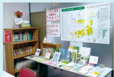
▲交流室の様子(図書展示時)

男女平等推進センター(フィフティ・フィフティ)では、男女共同参画に関する講座、女性の悩みごと相談、男女共同参画情報誌「ときめき」の発行、男女共同参画に関する図書展示・貸し出しなどの事業を行っています。市役所2階生活文化課内にありますので、ぜひご利用ください。詳しくは男女平等推進センター☎472・0061へ。