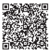
「ペットの飼い主の皆さんへ」の市ホームページQRコード