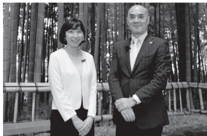
▲記念映像収録時の写真