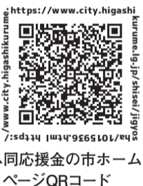
▲同応援金の市ホームページQRコード

申請は10月1日(木)～11月30日(月)に、〒203-10052、幸町3ノ4ノ12、東久留米市商工会宛て郵送または市ホームページからアクセスできる申請フォームから電子申請を。