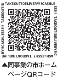
▲同事業の市ホームページQRコード