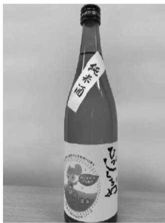
▲記念ラベル版「地酒ひがしぐるめ」