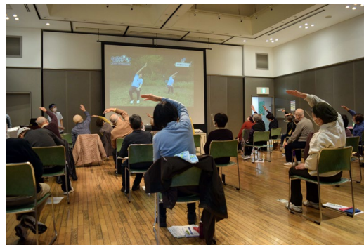
▲動画完成イベントの様子