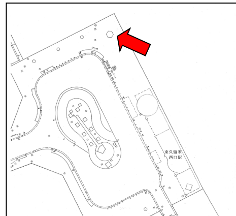
▲駅西口ロータリー案内図