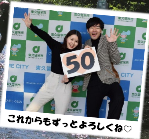
これからもずっとよろしくね♡