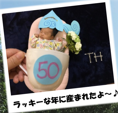
ラッキーな年に産まれたよ〜♪