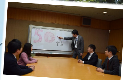
今年も一生懸命頑張ると!