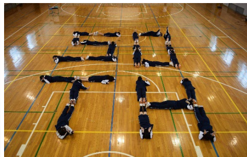
東久留米が大好き♡