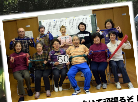
次の10年・20年に向けて頑張ると!