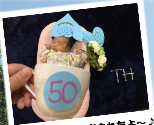
ラッキーな年に産まれたよ〜♪