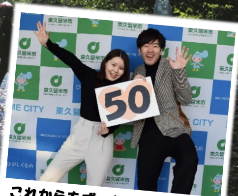
これからもずっとよろしくね♡