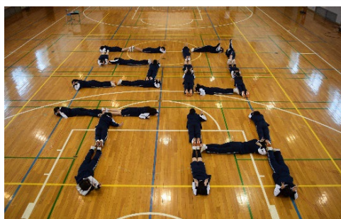
東久留米が大好き♡