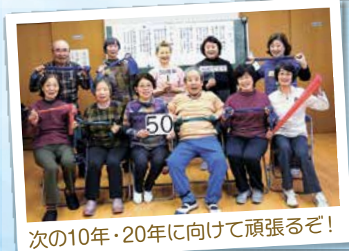
次の10年・20年に向けて頑張るぞ!