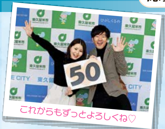
これからもずっとよろしくね♡

市制施行50周年にちなんで、「50」を写した人物写真と、一言メッセージを募集します。応募いただいた写真とメッセージは、順次市ホームページに掲載させていただきます。また、それを活用し、市制施行記念日に向けたカウントダウンを行います。気軽な写真から、工夫を凝らした写真まで、市民の皆さんの作品をお待ちしています。詳細は市ホームページをご覧ください。詳しくは応募・掲載に関することが秘書広報課☎470・7708、企画に関することが企画調整課☎470・7702へ。