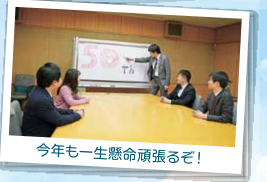
今年も一生懸命頑張るぞ!