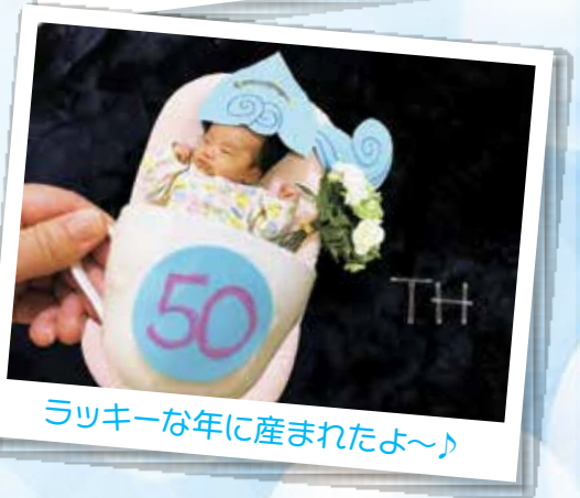
ラッキーな年に産まれたよ〜♪

市庁舎や東久留米駅西口、生涯学習センターをはじめとする市関連施設に、市制施行50周年記念ロゴマークをあしらったのぼり旗などを2月26日から順次設置しています。これらを背景にした記念写真もお待ちしています。ぜひご応募ください。