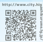
▲市ホームページのQRコード

市制施行50周年にちなんで、「50」を写した人物写真と、一言メッセージを募集します。応募いただいた写真とメッセージは、順次市ホームページに掲載させていただきます。また、それを活用し、市制施行記念日に向けたカウントダウンを行います。気軽な写真から、工夫を凝らした写真まで、市民の皆さんの作品をお待ちしています。詳細は市ホームページをご覧ください。詳しくは応募・掲載に関することが秘書広報課☎470・7708、企画に関することが企画調整課☎470・7702へ。