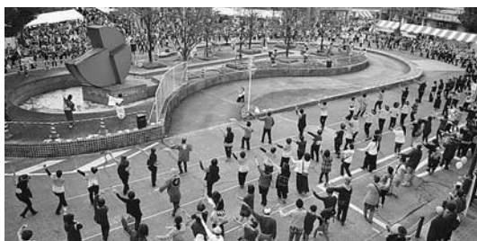
▲昨年の市民みんなのまつりの様子

今年も「市民みんなのまつり商工祭・農業祭」を11月9日(土) 正午～午後5時(開会式は午前11時から)と、10日(日) 午前10時～午後4時の2日間開催します(雨天決行)。 会場では、展示会や特産品の即売会、各種模擬店、ステージでのダンスや伝統芸能の発表など、多くのイベントが行われます。ぜひご来場ください。 詳しくは産業政策課 ☎470・7743へ。