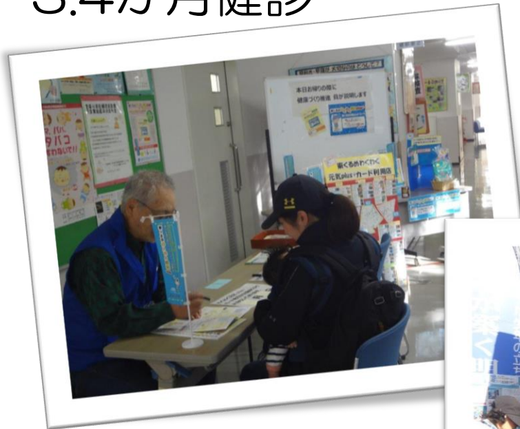
わくわく元気plus+ PR活動写真