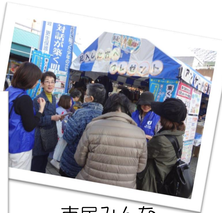
市民みんな のまつり