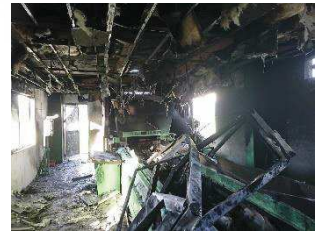
リサイクル工場が焼けてしまった事例

安定的なごみ処理の継続のため、リチウムイオン電池等は、指定収集袋には入れず、下記の分別にご協力をお願いします